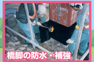
橋脚の防水・補強